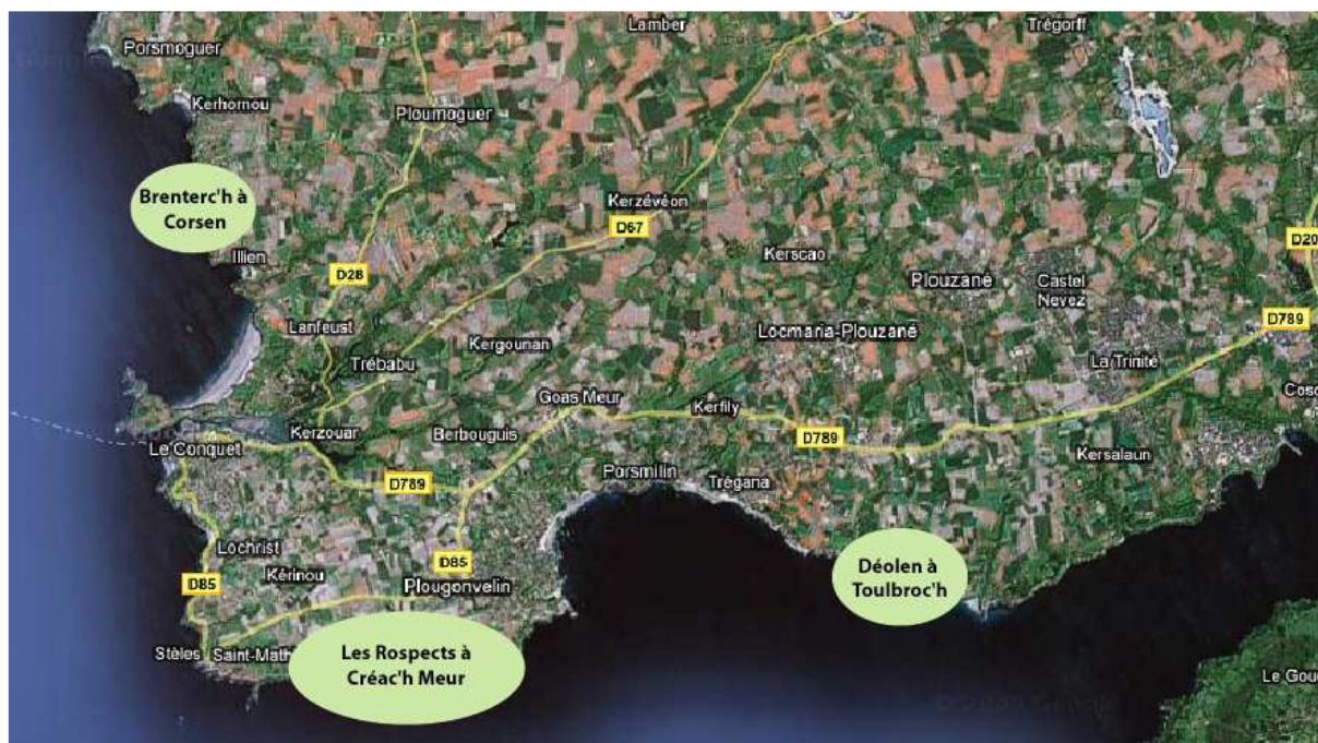
Figure 1 : 3 noyaux de crave à bec rouge du Bas-Léon